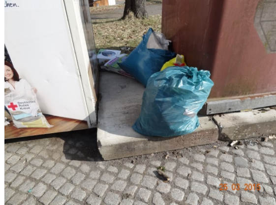
Bilder 6 und 7: illegale Ablagerungen, Standort Pockau, 25.03.2015