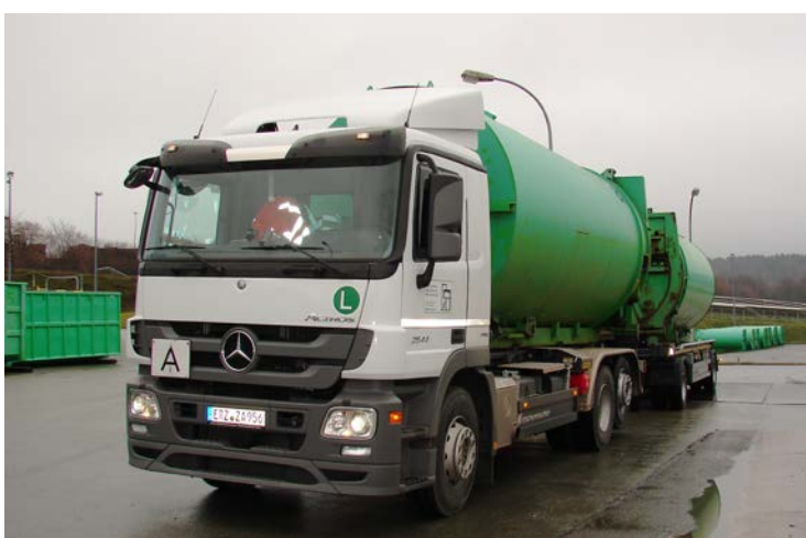
Bild 2: Transportfahrzeug des ZAS auf der Entsorgungsanlage in Niederdorf

33.031 t thermische Restabfallbehandlung SUEZ Energie und Verwertung GmbH Bayerische Straße 20, 06686 Lützen/OT Zorbau