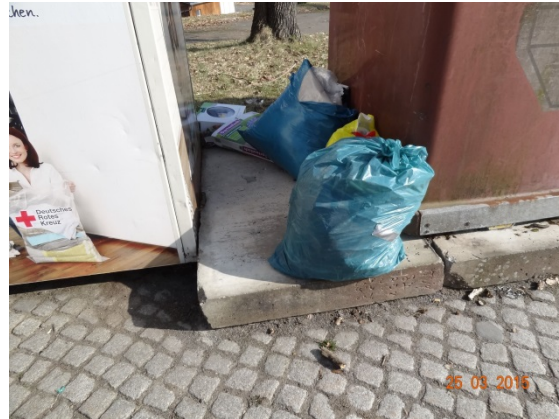
Bilder 6 und 7: illegale Ablagerungen, Standort Pockau, 25.03.2015