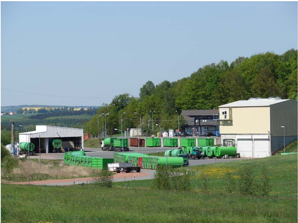
Müllumladestation und Wertstoffhof Niederdorf

Zweckverband Abfallwirtschaft Südwestsachsen Schlachthofstraße 12 09366 Stollberg